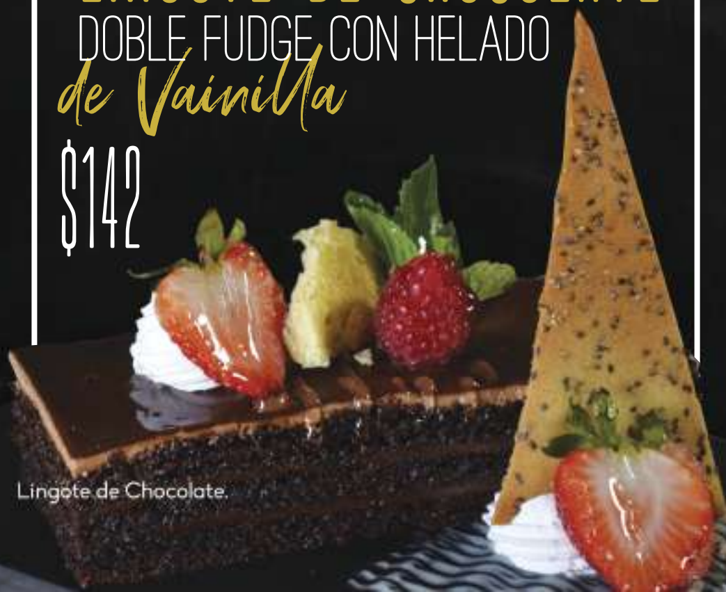
Lingote de Chocolate.